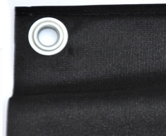
Polyestervepa med öljett.

Vepor kan ha olika upphängningssystem. De kan till exempel förses med öljetter, lister, kardborreband, en fäll runt om eller en metallstav uppe och nere. Valet av upphängningssystem beror på hur platsen för upphängning ser ut.