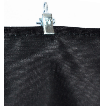
Polyestervepa med metallstav och metallknips.