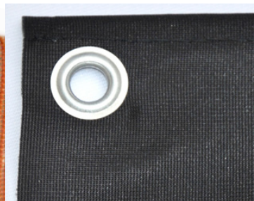
Polyestervepa med öljett.