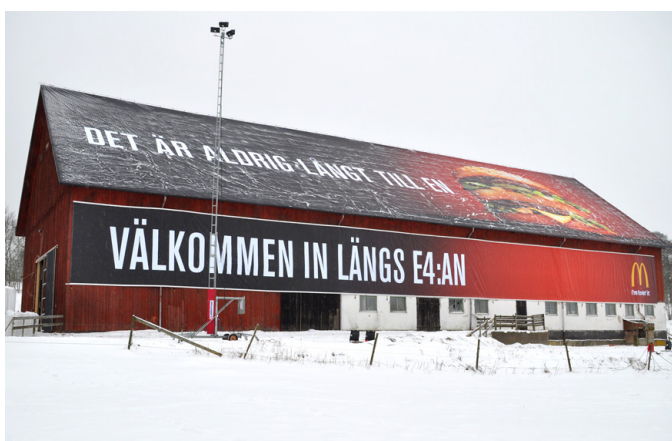
Fasadvepa på lada.

För att hänga upp en fasadvepa finns det olika upphängningssystem att välja bland. Det vanligaste är att använda öljetter eller kederlistor. Vi har också ett vepahissystem för att enkelt kunna byta vepa utan att stegar eller lift behövs. Men hjälp av en vinsch hissar man upp vepan och den hänger rakt och snyggt direkt. Systemet är slutet runt om vepan vilket gör att vinden inte kommer in bakvägen. Det är annars det som lätt trasar sönder vepor.